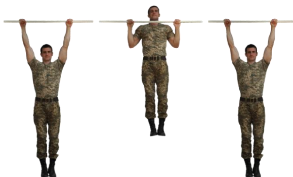
Рисунок 1 – підтягування на перекладині.

Перевірка вправи підтягування на перекладині проводиться у спортивних залах або на відкритих майданчиках. З вихідного положення, за командою “До снаряду”, підійти до перекладини, прийняти початкове положення вис хватом зверху та приступити до виконання вправи (див. рис. 1). Під час підтягування, у верхньому положенні, підборіддя підняти вище перекладини та опуститися на прямі руки у положення вису (положення вису фіксується кожного разу упродовж 1 – 2 с). Кожне правильно виконане підтягування зараховується оголошенням рахунку у положенні вису. Оголошення рахунку одночасно є дозволом на продовження виконання вправи. У випадку порушення вимог щодо виконання вправи особа, яка перевіряє вправу замість чергового рахунку подає команду “Не рахувати” коротко називає помилку, а після чергового повернення у початкове положення оголошує попередній рахунок.