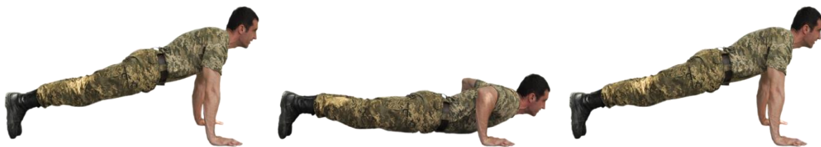
Рисунок 2 – згинання та розгинання рук в упорі лежачи.

Перевірка вправи згинання та розгинання рук в упорі лежачи виконується з вихідного положення упор лежачи (ноги разом, тіло пряме, руки на ширині плечей), згинання рук виконується до положення торкання грудями підлоги (див. рис. 2). Після розгинання рук положення упору фіксувати кожного разу упродовж 1 – 2 с. Рахунок оголошується кожного разу у положенні упору лежачи. Зараховується правильна кількість повторень. Час на виконання вправи – 2 хв.