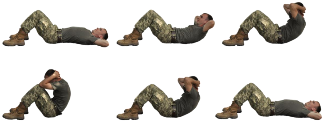
Рисунок 3 – згинання та розгинання тулуба із положення лежачи на спині