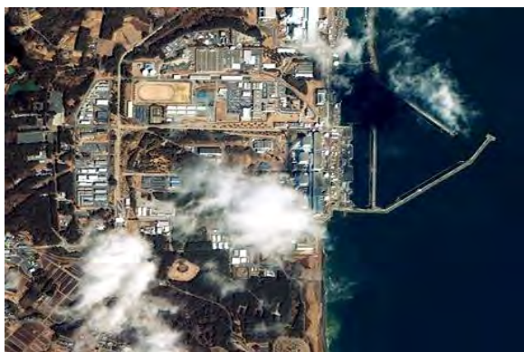
Рис. 3. Пример изображения, подверженного воздействию протяженных маскирующих помех (пожары при землетрясении, Япония, 2011 год)