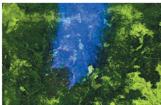
Рис. 4. Пример изображения, подверженного воздействию протяженных маскирующих помех (лесные пожары, Россия, 2010 год)

Задача устранения линии раздела задымленной и незадымленной областей изображения решена в работах [26 – 28] за счет использования методов математической морфологии второго порядка. Однако при использовании результатов, полученных в работах [26 – 28], существенно увеличивается аддитивный шум и подчеркиваются артефакты блочной структуры изображения, которые возникают вследствие потери части информации при ее сжатии. Вследствие предварительного оценивания коэффициентов отражения и поглощения, а также использования двухпроходных морфологических операций первого и второго порядка, алгоритмам обработки изображений [26 – 28] присуща значительная вычислительная сложность и, как следствие, недопустимо большое время обработки.