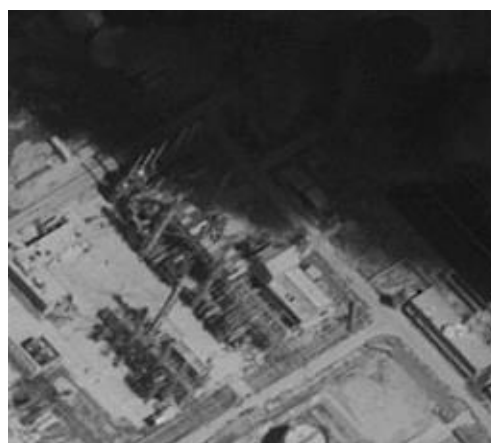
Рис. 5. Исходное изображение [11]

Эффективность использования общепринятых методик обработки изображений зависит от большого числа управляющих параметров, которые в большинстве случаев выбираются эмпирически [17 – 21, 29].