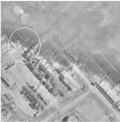
Рис. 6. Изображение, обработанное фрактальным методом [11]

При этом субъективные оценки являются не всегда удовлетворительными, так как в результате обработки могут маскироваться важные особенности изображения и, наоборот, привносятся артефакты. Последнее – субъективность восприятия – сильно усложняет применение формализованного подхода в достижении цели обработки изображений. Поэтому, при обработке изображений получили распространение методы, в которых часто отсутствуют строгие математические критерии оптимальности. Их заменяют качественные представления о целесообразности той или иной обработки, опирающиеся на субъективные оценки результатов [29].