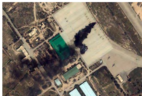
Рис. 2. Пример изображения, подверженного воздействию протяженных маскирующих помех (применение ВТО, Ливия, 2011 год)

К тому же, существующие методы компенсации дымки на изображениях [17 – 25] не решают задачу устранения линии раздела задымленной и незадымленной областей изображения. Это, в свою очередь, оказывает негативное влияние на последующие этапы обработки изображения, особенно на этапы координатной привязки изображений и обнаружения объектов разведки на изображениях.