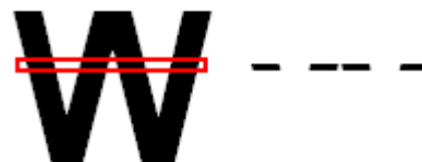
Рис. 1. Определение блока

нейшем под «блоком» будем подразумевать лишь те их них, которые несут в рамках решаемой задачи смысловую нагрузку, а именно – блоки черных пикселей. Например, рис. 1 иллюстрирует линию изображения, которая состоит из четырех блоков.