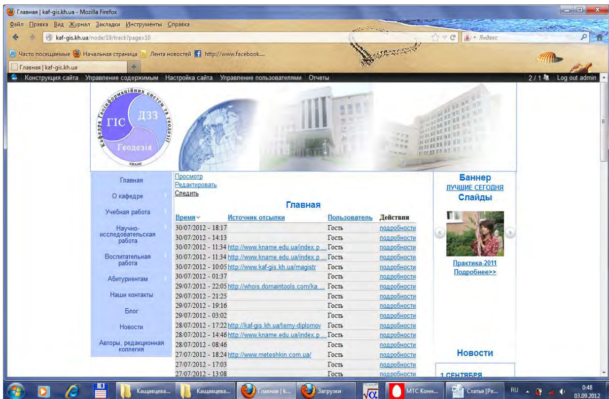
Рис. 2. Иллюстрация главной страницы сайта с информацией о ее посещении

Учитывая вышеизложенное, возникла задача – на основе данных, полученных с помощью Google Analytics, проанализировать эффективность использования сайта при профессионально-ориентированной работе с абитуриентами.