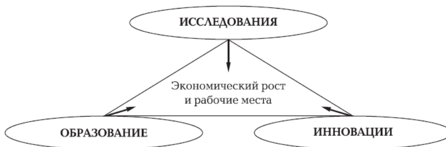
Рис. 1. Лиссабонская стратегия

Все три составляющие, представленные в Лиссабонской стратегии (рис. 1) – образование, исследования и инновации, лежат в сфере деятельности современных университетов.