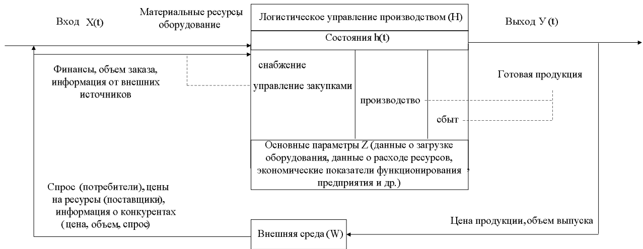
Рис. 1. Системная модель процесса управления закупками

Следует определить и формализованно представить параметры данной модели.