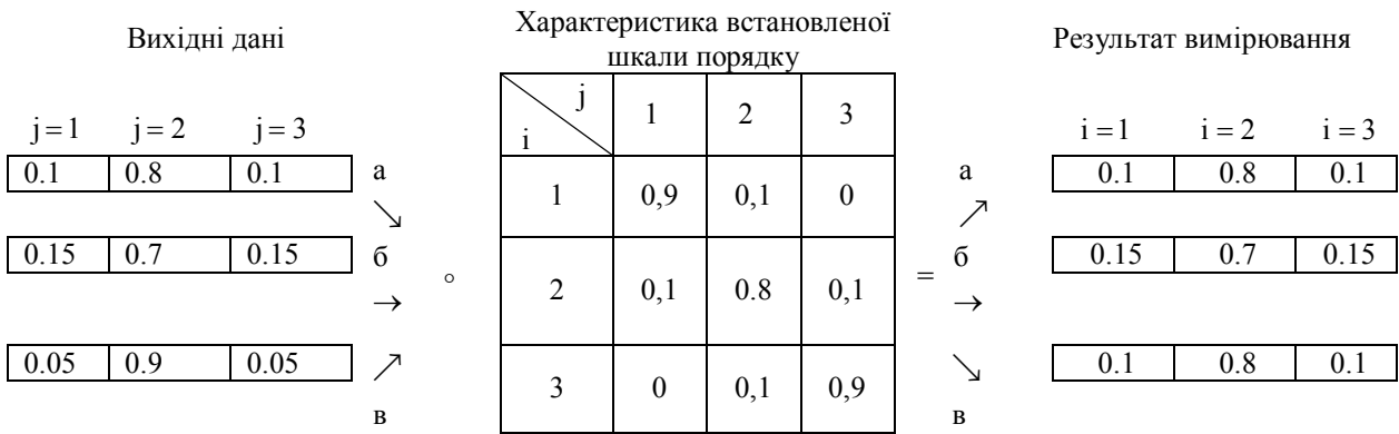
Рис. 5. Результати моделювання процедури отримання результату вимірювання з характеристикою невизначеності