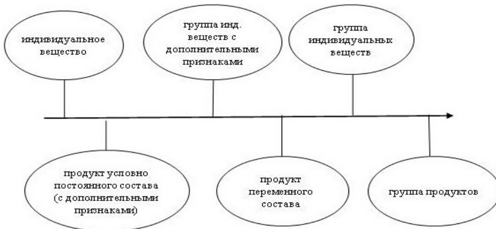
Рис. 1. Условная шкала дефиниционной неопределённости

Для оценки «масштаба проблемы» были проанализированы документы, в которых установлены санитарно-гигиенические нормативы для разных типов вод. Анализ позволил выявить шесть характерных ситуаций, связанных с дефиницией показателя, которые были классифицированы с точки зрения потенциальной значимости дефиниционной неопределённости измерений. Они показаны на рис. 1, где стрелка соответствует условной шкале дефиниционной неопределённости, а круги – шести её уровням.