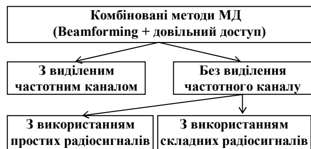
Рис. 2. Класифікація комбінованих методів МД

Загальну класифікацію комбінованих методів МД на основі просторового та випадкового наведено на рис. 2.