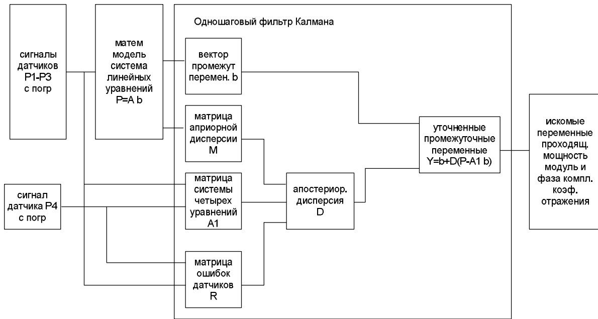
Рис. 2. Структурная схема алгоритма с применением фильтра Калмана

Проведение моделирования необходимо для проверки работоспособности алгоритма, когда сигналы датчиков не идеальные, а реальные с шумами. Моделирование заключается в добавлении в сигналы датчиков случайных погрешностей. Причем следует обратить внимание на равенство нулю математического ожидания этой погрешности, то есть в сумме шумы должны взаимно компенсироваться. Что касается закона распределения вероятностей для погрешностей датчиков, то в отличие от метода наименьших квадратов, оно не обязательно должно быть нормальным. Набираем массив данных путем расчетов вместо измерений. По произвольно взятым значениям модуля и фазы комплексного коэффициента отражения нагрузки определяем значения сигналов датчиков. Получаем вместо сигналов датчиков их расчетные значения. И проводим все операции, которым подвергались бы при обработке сигналы датчиков, будь они получены измерением. Результаты моделирования для четырех датчиков для двух коэффициентов отражения 0,2 и 0,5 представлены на рис. 3, а, б. Фаза коэффициента отражения предполагается равной 0. Мощность генератора условно считаем единичной.