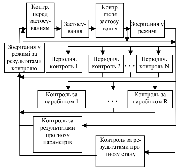
Рис. 1. Взаємозв'язок процедур підсистем обслуговування і контролю в СЗЕ СТК

їх надійність і готовність, слід віднести тривалість, періодичність і достовірність контролю СТК.