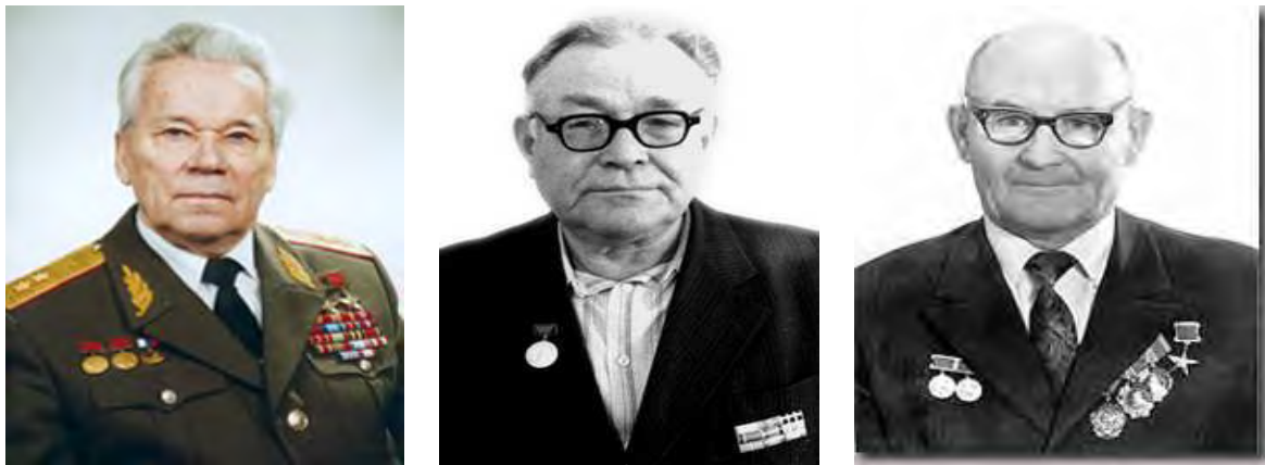
Рис. 6. Видатні зброярі післявоєнного часу (зліва направо): Калашников Михайло Тимофійович, Драгунов Євген Федорович, Макаров Микола Федорович

У 1963 році розроблено 7,62-мм самозарядну снайперську гвинтівку Драгунова (СГД), яка під індексом СГДС модернізована у 1992 р.