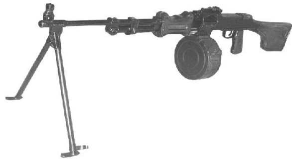
Рис. 5. 7,62-мм ручний кулемет В.А. Дегтярьова

Високими темпами велись розробки нових зразків зброї та вносились удосконалення у вже існуючі зразки зброї. Так на заключному етапі війни були прийняті на озброєння ручний кулемет В.А. Дегтярьова (РКД зр. 1944 р.), розроблений під новий проміжний (середній за потужністю між пістолетним та гвинтівковим) патрон калібру 7,62×39-мм зразка 1943 року (рис. 5) та великокаліберний кулемет С.В. Владимиринова (ВКВ).