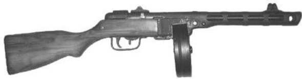
Рис. 3. 7,62-мм пістолет-кулемет Г.С. Шпагіна