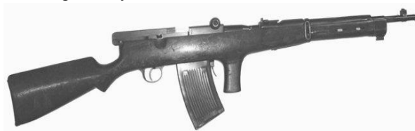
Рис. 1. 6,5-мм автомат В.Г. Федорова

В.Г. Федоровим (рис. 1). Автоматична дія автомата ґрунтувалась на використанні відбою ствола при його короткому ході.