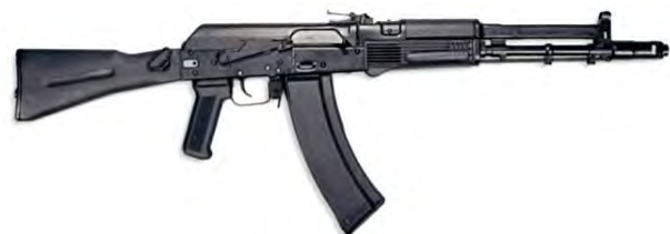
Рис. 7. Зовнішній вигляд автоматів АК107 та АК108

Відмінністю автоматів нового покоління АК107 (5,45×39-мм) та АК108 (5,56×45-мм) є збалансована безударна система автоматики з розподіленими масами (рис. 7).