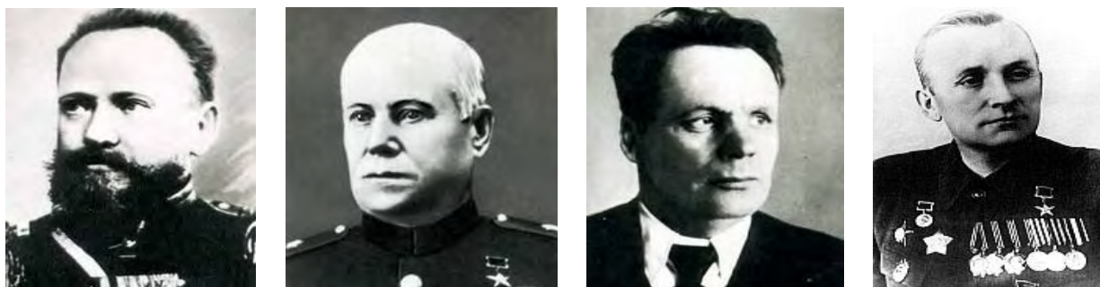
Рис. 2. Видатні зброярі Великої Вітчизняної війни (зліва направо):

У 20-і роки у конструюванні та створенні нових зразків стрілецької зброї прийняли участь молоді зброярі-конструктори В.О. Дегтярьов, Г.С. Шпагін, П.М. Горюнов, С.Г. Сімонов, А.І. Судаєв та інші (рис. 2).