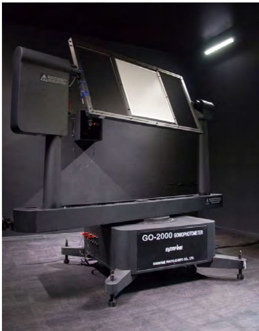
Рис. 1. Гоніофотометр Everfine GO-2000H в темній кімнаті зі змонтованим досліджуваним зразком

Одним з основних робочих інструментів Центру є автоматизований гоніофотометр Everfine GO-2000H (рис. 1), який складається з поворотного механізму (зображений на фото), фотоприймача, блоку керування та блоку живлення досліджуваного зразка. Процес вимірювання виконується в так званій «темній кімнаті» – фотометричному тунелі довжиною 16 метрів, в якому всі поверхні пофарбовані чорною фарбою для зниження впливу розсіяного світла. Поворотний механізм та фотоприймач встановлюються на різних кінцях приміщення. Процес вимірювання просторового розподілу сили світла передбачає обертання поворотним механізмом досліджуваного зразка навколо його фотометричного центру та послідовні вимірювання сили світла в напрямі фотоприймача.