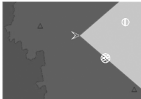
Рис. 3. 2-й варіант