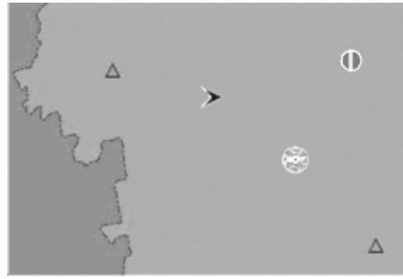
Рис. 1. Вихідна ІМ

Розглянемо варіанти які були запропоновані (рис. 2 – 4).