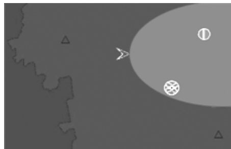
Рис. 4. 3-й варіант

Варіант на рис. 2 відрізняється від базового використання кодування яскравістю кольору.