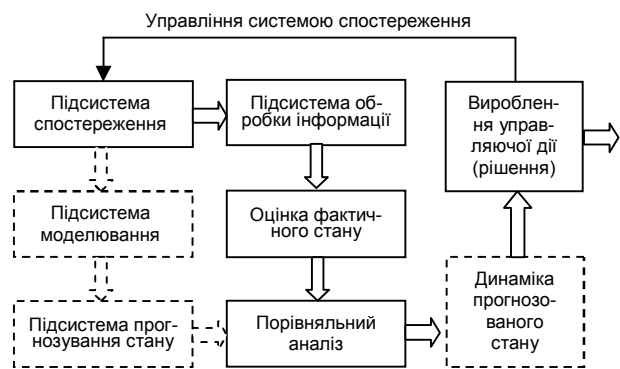
Рис. 2. Структурна схема системи управління екологічного моніторингу та контролю

Аналіз літератури [5 – 7], а також організаційно-технічних заходів щодо здійснення екологічного моніторингу і контролю показав, що система управління в загальному випадку може бути зображена у вигляді структурної схеми на рис. 2, яка здійснює оцінку фактичного стану середовища або довкілля.