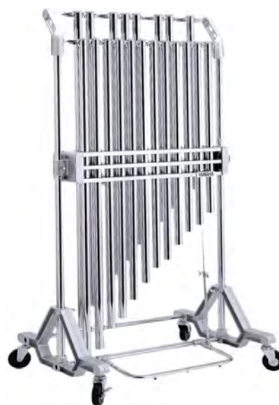
Рис. 1. Современные оркестровые колокола

На рис. 1 приведен пример оркестровых колоколов, которые чаще всего используются в оркестрах.