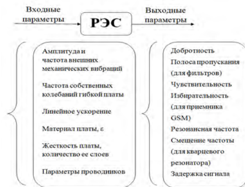
Рис. 3. Параметры РЭС для построения системологической модели

Например, на выходные параметры конструкции бортового РЭС на гибком печатном основании могут влиять такие параметры (рис. 3):