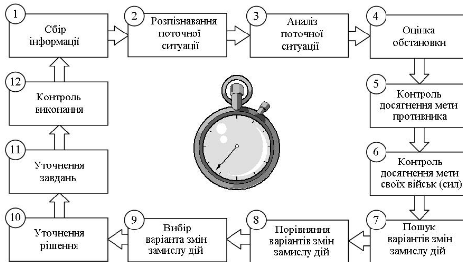
Рис. 3. Схема циклу управління з процесами підготовки й прийняття рішення в ході реалізації плану воєнної діяльності

інформація попередніх етапів). Кожен послідовний часовий зріз циклу управління видозмінює змістове наповнення функцій, але на кожному послідовному часовому зрізі зміст функцій характеризується спадковістю елементів раніше прийнятих рішень.