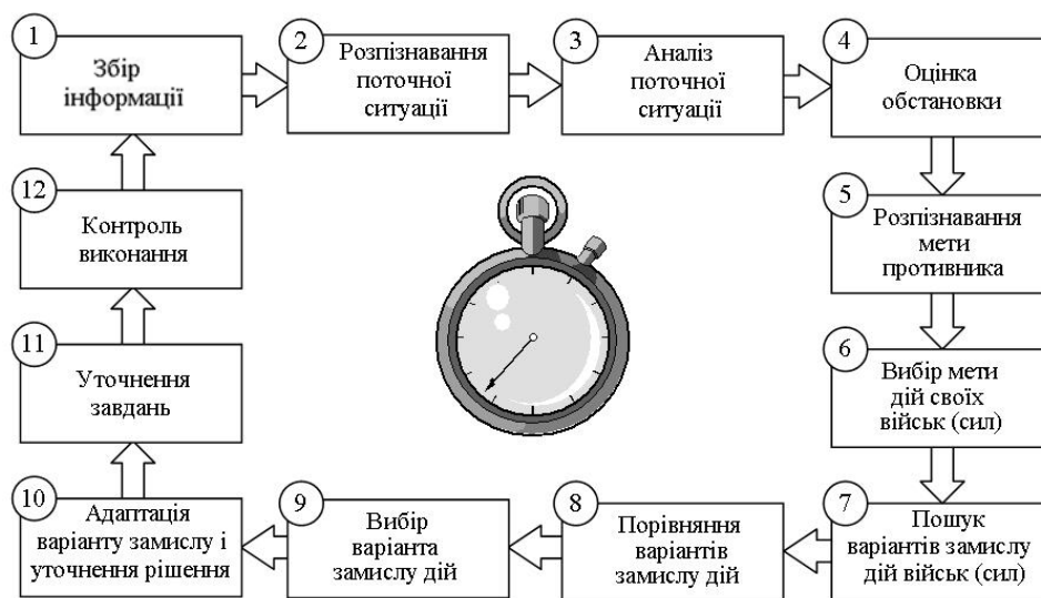
Рис. 2. Схема циклу управління з процесами підготовки й прийняття рішення на початку реалізації плану воєнної діяльності

Від етапу до етапу підготовки і ведення воєнних (бойових) дій функціональні завдання органів управління змінюються за своїм змістом. Так, якщо на етапі завчасної підготовки ситуації формувалися безпосередньо органами управління, то при завершенні етапу безпосередньої підготовки, противник розкриває свою діяльність й командир з наявного переліку формалізованих ситуацій вибирає ту, яка найбільш підходить до реальних умов (2 – рис. 2 і рис. 3). Якщо на етапі завчасної підготовки органи управління формували варіанти дерев цілей, то наприкінці етапу безпосередньої підготовки вони здійснюють розпізнавання можливих цілей збройної боротьби, тим самим розпізнають і варіант замислу дій противника (5, 6 – рис. 2).