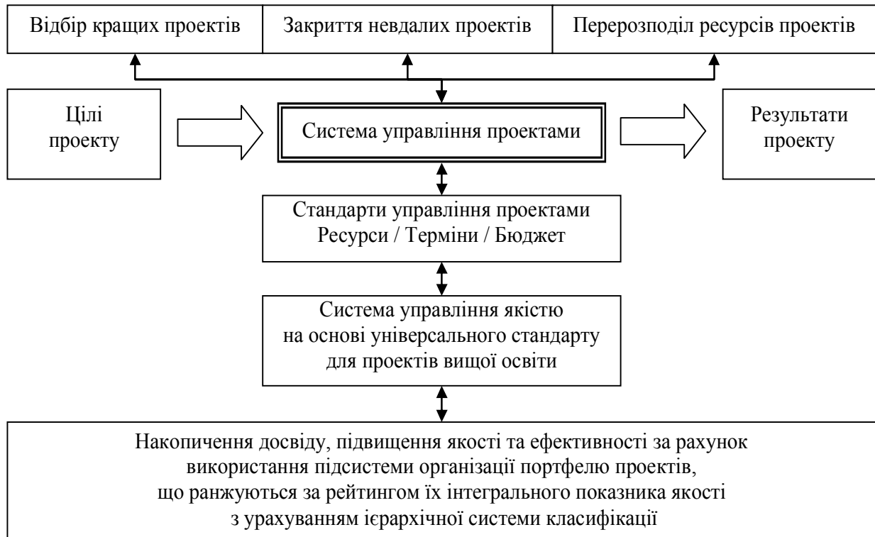
Рис. 1. Концептуальна модель освітньої корпоративної інформаційної системи управління проектами