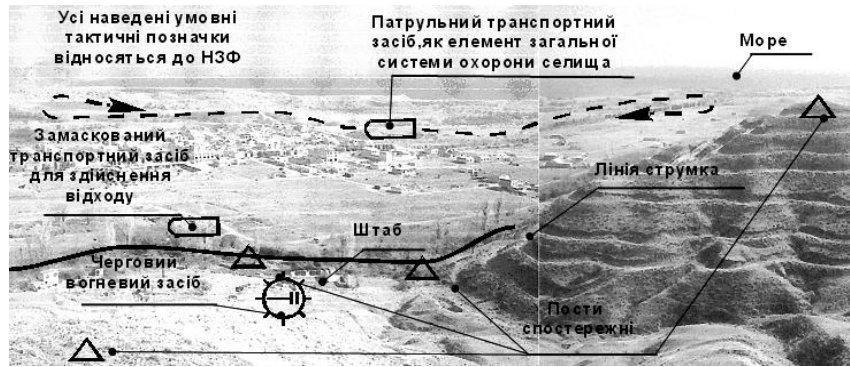
Рис. 3. Схема безпосереднього охоронення штабу НЗФ

Автори нагадують, що складені з урахуванням поглядів експертів прогностичні моделі об'єктів розвідки, а на їх підставі вході польових досліджень та навчань емпіричні моделі в цілому, прив'язані до конкретних умов і визначеності прогнозу тактичних дій НЗФ. Тому вони не претендують на універсальність. Подальші зусилля щодо зазначеної проблеми доцільно, на погляд авторів, зосередити на об'єктах розвідки, пов'язаних з такими формами діяльності НЗФ як: перебування у таборі бойового зладжування, вимушена передислокація з однієї маскува-