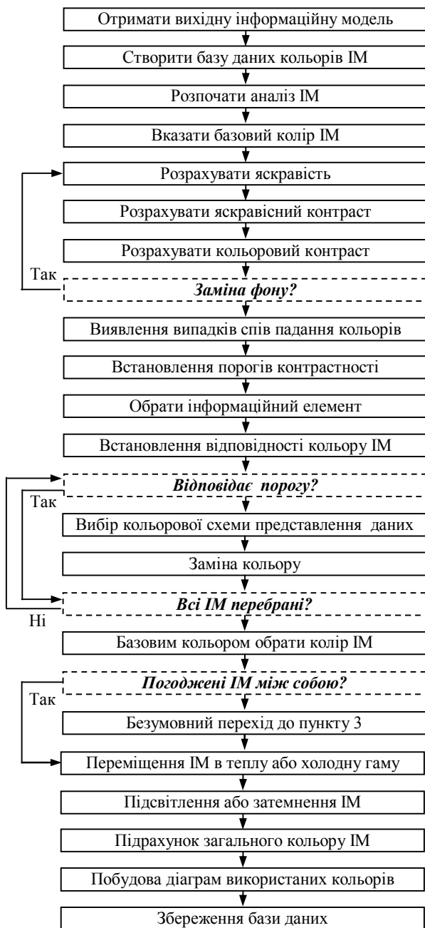
Рис. 3. Структура розробленого методу

В роботі були розглянуті основні моделі представлення кольорів, їх принципи та загальна характеристика.