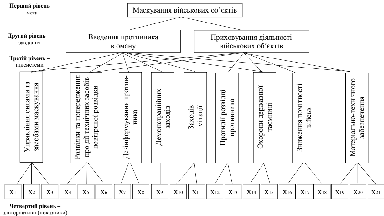
Рис. 1. Ієрархічне зображення задачі визначення коефіцієнтів важливості показників ефективності варіанту складу сил та засобів маскувannya військових об'єктів

вуючи їх вплив (вагу) на загальну для них характеристику попереднього оцінювання. При цьому, підсистеми маскувannya (управління силами та засобами маскувannya, розвідки та попередження про дії технічних засобів повітряної розвідки, дезінформування противника, демонстраційних заходів, заходів імітації, протидії розвідці противника, охорони державної таємниці, зниження помітності військ, матеріально-технічного забезпечення), визначаються певною сукупністю показників, наведеною в табл. 1.