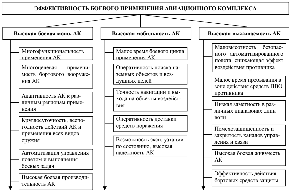
Рис. 1. Схема, отражающая связи эффективности боевого применения авиационного комплекса (АК) с его основными боевыми свойствами