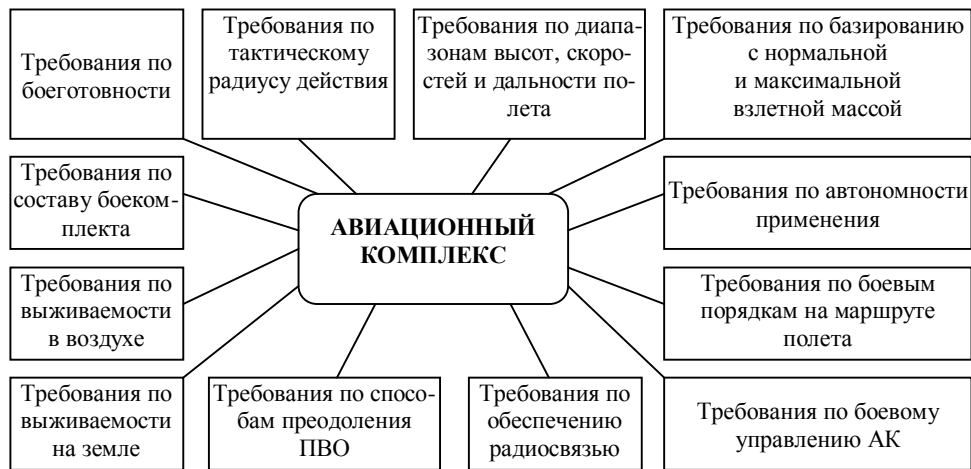
Рис. 2. Основные оперативно-тактические требования, предъявляемые к авиационному комплексу

ОТТ, вытекающие из роли и места АК в системе вооружения вида (рода) авиации, должны отражать: назначение и область применения АК; задачи, возлагаемые на АК; требования к основным его боевым свойствам; условия боевого применения АК и проч. ОТТ должны служить системно-объединяющей основой формирования ТТТ, предъявляемых к АК, и входить в их состав как одна из основных групп требований. Обоснованные ОТТ должны представляться в форме оперативно-тактического задания заказчика, определяющего оперативно-тактический замысел создания АК и применения его по назначению, задачи, возлагае-