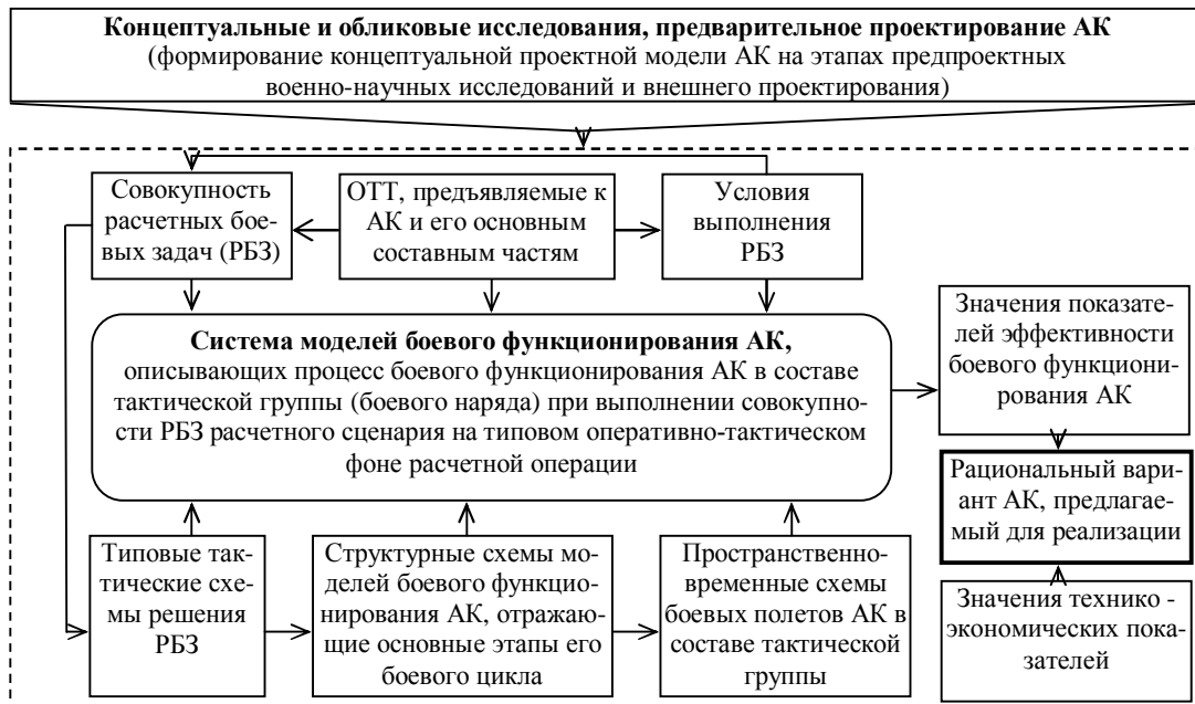
Рис. 4. Обобщенная схема технологии оценивания значений показателей эффективности боевого функционирования АК на концептуальной стадии его создания