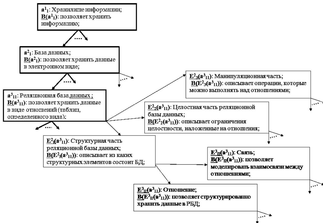
Рис. 1. Фрагмент ИККМ в области баз данных

объектов, соответствующих системам-классам i -го уровня иерархии с их функциональными назначениями ( k_i – число элементов множества A^i ; k_1 = 1 , т. е. на первом (верхнем) уровне иерархии находится только один объект (a_1^1, V(a_1^1)) (система-класс, описывающая понятие-категорию); k_2 \geq 2 и k_{i+1} \geq 2k_i ( i = \overline{2, N-1} ) [5].