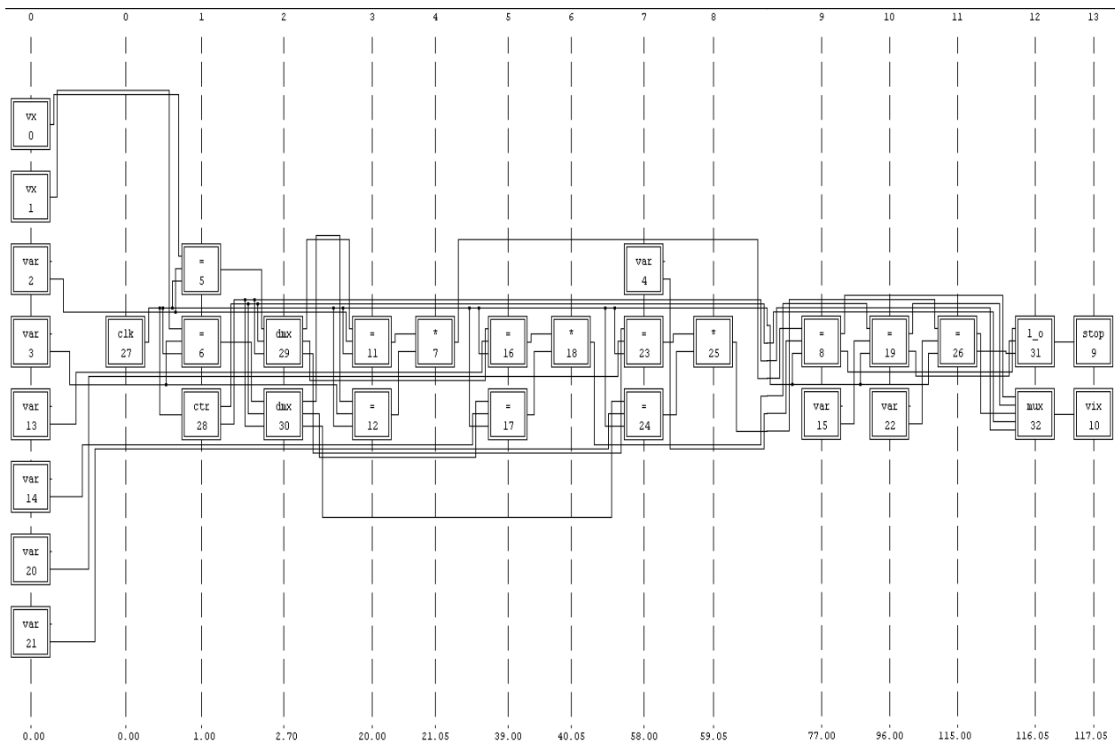
Рис. 2. Функціональна схема ОДК-процесора

#include <stdio.h> void main(void) { int a,b; int z; scanf("%d %d %d %d",&a,&b); z= a * b ; printf("%4d\n",z); }