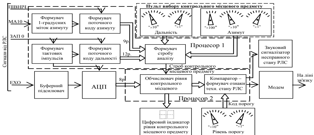
Рис. 2. Структурна схема пристрою оцінки технічного стану РЛС за параметрами прийнятого сигналу від контрольного місцевого предмету

відбиваючими властивостями. Дальність контрольного місцевого предмету не повинна перевищувати 5...10 км від РЛС, щоб знизити вплив рефракції радіохвиль на параметри відбиття.