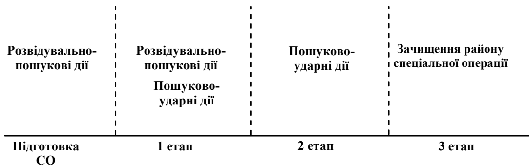
Рис. 1. Перелік пріоритетних способів дій силових відомств держави у період підготовки та проведення СО

Перелік пріоритетних способів дій силових відомств держави у період підготовки та проведення зазначеної СО проілюстрований на рис. 1. На етапі підготовки операції ці дії можуть характеризуватись як розвідувально-пошукові, з тлумаченням складової «пошукові» у розумінні «виявлення» об'єктів розвідки, тобто визначення їх наявності або відсутності у заданому районі. Така інформація може бути отримана, наприклад, за допомогою комерційних супутників «відкритого борту», засобів авіаційної розвідки (в тому числі безпілотних), а також завдяки агентурній розвідці і оперативно-розшуковій діяльності певних силових відомств держави. На першому етапі періоду проведення операції розвідувально-пошукові дії продовжуються, але складова «пошукові» на цьому етапі має тлумачитись, і як спосіб ведення військової розвідки розвідувальними органами силових відомств, і як спосіб дій притаманним внутрішнім військам.