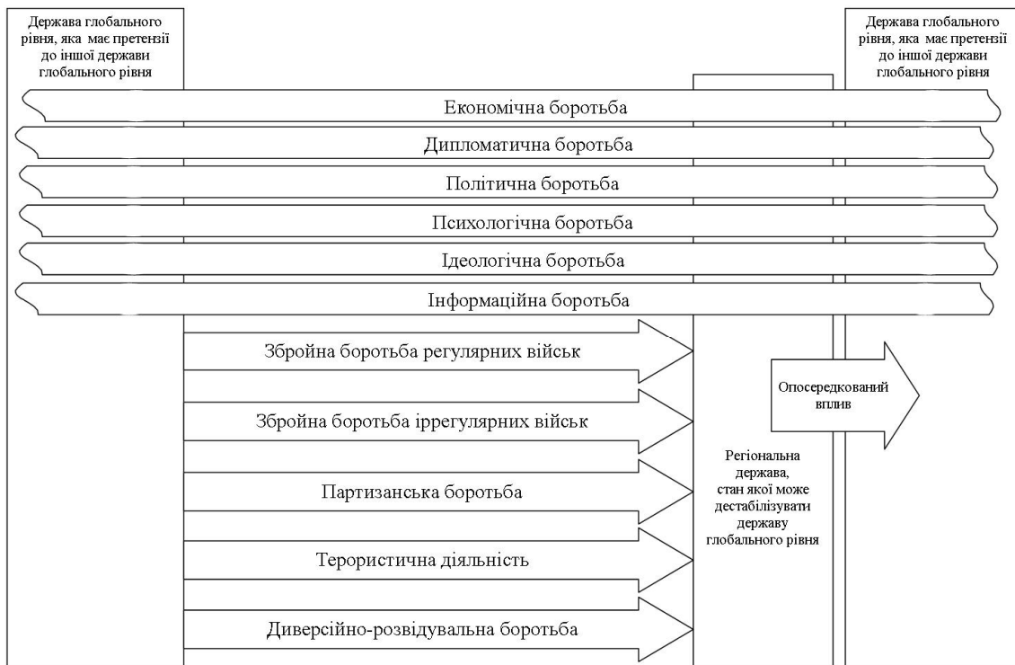
Рис. 2. Хід латентної війни з використанням опосередкованих конфліктів

цивілізаційного середовища з використанням всіх наявних сил та засобів, включаючи власні збройні сили, як інструменту досяжності політичної мети.