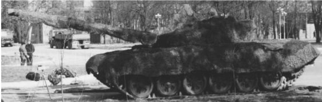
Рис. 2. Застосування маскувальної сітки контраст на танку

В західних країнах відбувається розробка красок та спеціальних покриттів, що послаблюють теплове випромінювання ОБТ. Наприклад, фірма "VTR material systems" розробила матеріал "пермиррем", який забезпечує зниження теплового випромінювання ОБТ на рівні фону рослинності, що оточує військову техніку. Цей матеріал уявляє собою пластмасу, що посилена скловолокном з додатками спеціального пігменту і використовується як стійкі, стрижні, козирки, парасольки та інше. Інші матеріали цієї фірми ("силверам" та "периарам") застосовують для радіо-поглинання. Слід відзначити, що наведені матеріали не задовольняють вимогам транспортальності, бо для маскування броньованих об'єктів потребують великого об'єму.