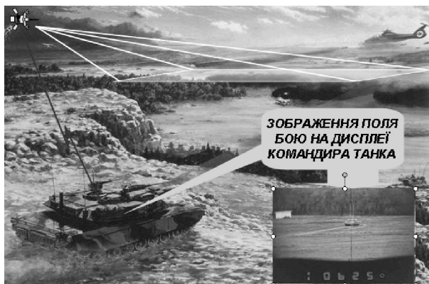
Рис. 1. Дії стратегічної розвідки в інтересах тактичної ланки [2]

Питання маскування пов'язано з протидією високоточної зброї. Вочевидь, високоточна зброя є високо вартісною, тому її застосування буде відбуватися в першу чергу по найбільш важливим цілям (переважно стратегічного рівня). Але з розвитком техніки спостерігається суттєве здешевлення систем розвідки та високоточного наведення, що сприяє їх все більшому застосуванню для інформаційного забезпечення бойових дій та ураження техніки танкових (механізованих) підрозділів. Під час грузинсько-осетинського конфлікту з обох сторін активно здійснювалася авіаційна розвідка з залученням бойових літаків та безпілотних літальних апаратів. В роботі [2] відмічається, що під час ведення бойових дій у якості засобів розвідки все більше залучаються космічні засоби, доля яких серед інших досягає 70 %. У останніх збройних конфліктах з'явилася тенденція щодо застосування космічних систем в інтересах видів збройних сил, зокрема здійснення розвідки в інтересах тактичної ланки (рис. 1).