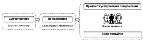
Рис. 2. Загальна модель діяльності по впливу

Загальна модель діяльності щодо впливу, яка застосовується під час планування інформаційних операцій, заснована на моделі соціальної комунікації, яка широко відома в соціології, маркетингу та рекламі (рис. 2).