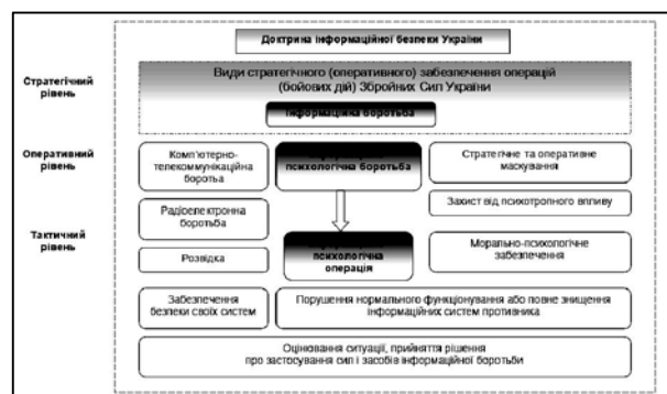
Рис. 1. Місце інформаційних операцій в системі ІБ ЗС України

Основними складовими ІБ є: комп'ютерно-телекомунікаційна боротьба; інформаційно-психологічна боротьба, основним видом якої є ІПО; радіоелектронна боротьба; розвідка; стратегічне (оперативне) маскування; захист від психотропного впливу; морально-психологічне забезпечення; забезпечення безпеки своїх систем; порушення нормального функціонування або знищення інформаційних систем противника (рис. 1) [7, 8].