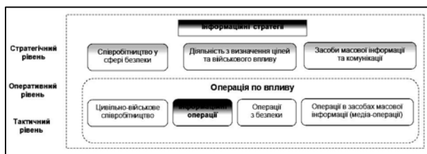
Рис. 3. Основні складові операції по впливу

Відомі з відкритих джерел публікації свідчать, що операції по впливу містить 4 основні компоненти: цивільно-військове співробітництво; інформаційні операції; операції з безпеки та операції в засобах масової інформації (медіа-операції) (рис. 3).