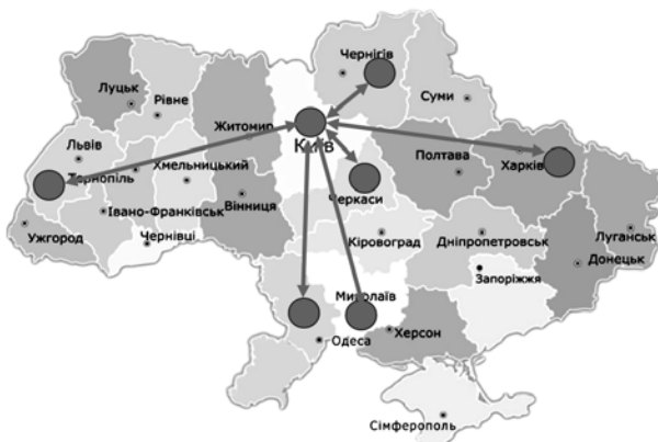
Рис. 3. Модель реплікації даних між обласними центрами

Серед поширених СКБД виділяються дві системи: PostgreSQL, MySQL. Однак, слід зазначити, що MySQL має певні складнощі при масштабуванні і тому комерційні хмарні системи (такі як Amazon – лідер ринку надання хмарних послуг) не пропонують використовувати MySQL при об'ємах даних більш, ніж 3 ТБ [9], натомість як PostgreSQL не має таких обмежень. Комерційні системи, що підтримують реляційну модель та реплікації, такі як Oracle, MS SQL Server неприйнятні через закритий вихідний код та значну ліцензійну вартість. Враховуючи досвід Amazon [8] та перераховані критерії, слід обрати саме PostgreSQL.