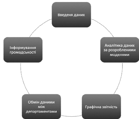
Рис. 4. Функціональні задачі системи

Важливо зауважити, що пропонується саме веб-орієнтований підхід до створення portalу. Це надасть змогу підтримати будь-які мобільні пристрої, які мають вбудований веб браузер та вихід в інтернет. Таким чином, наповнювати БД інформацією, також як і скористатися інформацією, можна буде з любого терміналу, який має доступ, з місця пожежі чи надзвичайної ситуації, тощо. Даний підхід краще, аніж використання спеціалізованих додатків під мобільні операційні системи, такі як Android, iOS, Windows mobile, адже кожна з них потребує наявності команди розробників виключно під дану операційну систему.