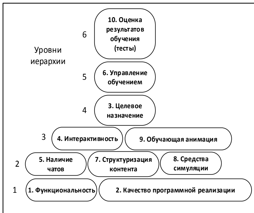
Рис. 2. Иерархическая модель критериев оценивания системы поддержки E-learning

На рис. 2 ПРИВЕДЕН результат построения иерархической модели критериев оценивания системы поддержки E-learning.