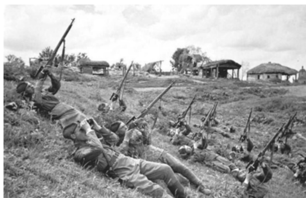
Рис. 1. Ураження повітряного об'єкта у роки другої світової війни

В сучасних радіолокаційних станціях зазначені вище недоліки усуваються наступними шляхами. Істотно покращується роздільна здатність РЛС, застосовуються складні сигнали, використовуються багатфункціональні антенні системи з можливістю фокусування енергії в певному обмеженому об'ємі простору, застосовується апаратура ідентифікації цілі. Наприклад, легкі БПЛА з малою ЕПР, що рухаються порівняно з невеликою швидкістю можуть сприйматись РЛС, як птах і т.п..