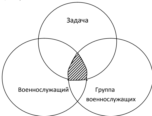
Рис. 3. Диаграмма Венна (модель трех кругов)

в котром пересікаються все три окружности. Работая над решением поставленной задачи, члены команды стремятся к этой цели ради успеха всей команды, одновременно развиваясь как личность в её составе. Для того чтобы достичь гармоничного существования трех рассматриваемых элементов, необходимо представить роль военного менеджера в команде, поставив его на место лидера, а скорее всего на место подчиненного, работающего во имя общей цели. Функция военного менеджера – поддерживать целостность команды и её боевой дух. Задача команды – реализовывать задуманное. Военный менеджер выполняет свою функцию, действуя от имени и по поручению остальных членов команды, не отдавая им приказов и распоряжений. Однако военному менеджеру следует помнить главное (если вы возглавляете команду, а не просто группу из нескольких военнослужащих) о вас будут судить другие (члены вашей команды, вышестоящие начальники и коллеги) не по вашим персональным достижениям, а по результатам деятельности команды в целом;