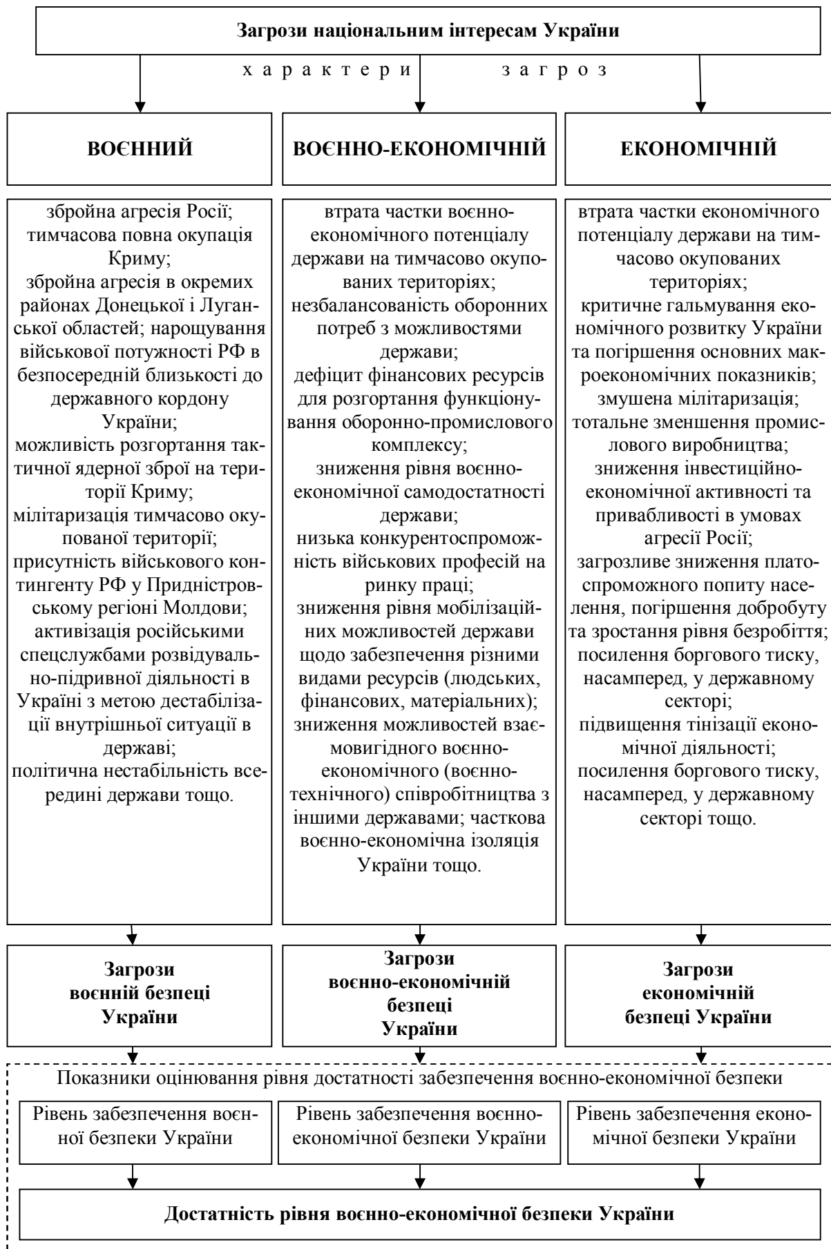
Рис. 2. Загрози воєнно-економічній безпеці України на період 2016 – 2020 рр.