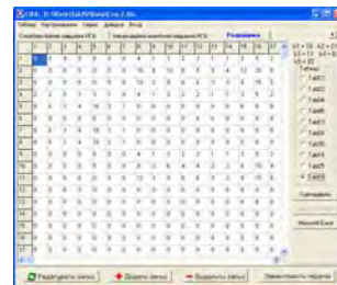
Рис. 3. Зовнішній вигляд панелі розрахунку коефіцієнтів складності побудови системи ІАЗ НГУ

Створений програмний інструмент для структурно-функціонального синтезу системи ІАЗ