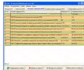
Рис. 1. Формування різноманітних просторів та базисів

В результаті математичного моделювання програма формує та визначає базиси другого рівня Tab113-Tab135 (рис. 2), базиси третього рівня Tab114, Tab125 та нарешті базис коефіцієнтів складності побудови системи ІАЗ НГ України – Tab115 (рис. 3), який розраховується за виразом 16.