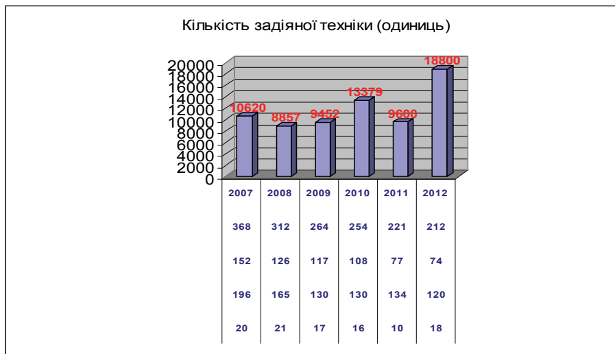
Рис. 2. Динаміка залежності кількості одиниць задіяної техніки від надзвичайних ситуацій

На діаграмі (рис. 2) показана динаміка залежності кількості одиниць задіяної техніки від кількості НС (в цілому, природного, техногенного, соціального характеру) за 2007–2012 роки [13].