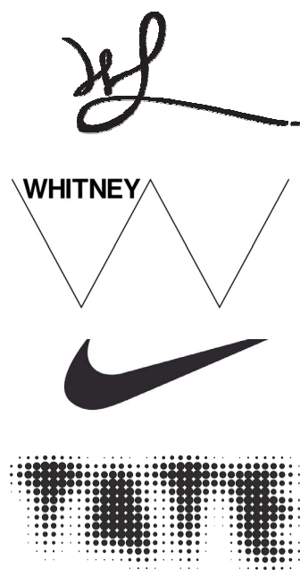
Рис. 1. Firmenne znaki i logotipy, peredavayushchie vpechatleniya: zhenshen'nyy, legkiy, dinamichnyy, myagkiy

V romane Germana Gesse «Igra v biser» opisuyetsya nekeya (pridumannaya) igra, v kotoroy igroki razыgrыvayut partii, operiruyа всем содержанием i всеми ценностями мировой культуры. V основе игровых операций такой игры лежат, по-видимому, ассоциация и аналогии между различными предметами и явлениями. А язык игры – это некий универсальный язык, позволяющий игрокам описывать всевозможнейшие предметы, явления и отношения между ними. Гессе в качестве основных составляющих языка игры называет математику и музыку: по-видимому, потому, что именно они обладают наиболее высоким уровнем абстракции и благодаря этому могут быть использованы для описания всего многообразия сущностей реального мира. Аналогом названных языков в визуальной сфере можно считать язык графической композиции, на котором так же могут быть созданы образы различных предметов и явлений. И использование такого графического языка – вовсе не выдумка и не игра, а будни графического дизайна.