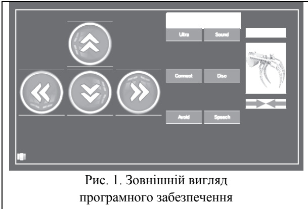
Рис. 1. Зовнішній вигляд програмного забезпечення

За розпізнавання голосу в програмі AppInventor 2.0 відповідає модуль під назвою SpeechRecognizer, який дозволяє розпізнавати голос за допомогою інтернет-з'єднання з сервісами Google.