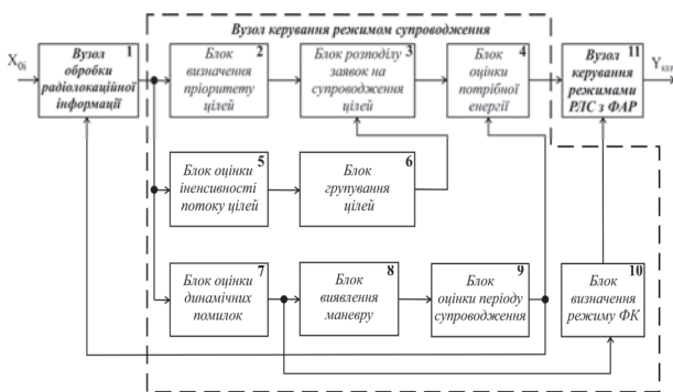
Рис. 1. Структурна схема вузла керування режимом супроводження багатofункціональної РЛС з ФАР

де \hat{X}_i – оцінки параметрів траєкторії на момент часу t_i ; X_{ei} – екстрапольовані значення вектору вимірюваних параметрів; K_i = \psi_i R_i^{-1} – коефіцієнт посилення фільтру, обумовлений значеннями елементів КМП оцінок параметрів траєкторії \psi_i та вагою (точністю) вимірів, що визначаються КМП помилок вимірювань R_i .