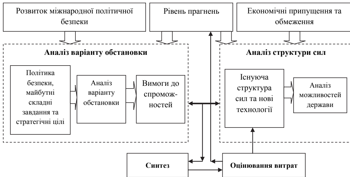
Рис. 2. Підхід до оцінювання стратегічної обстановки в процесі планування на основі спроможностей

У загальному вигляді показник здатності країни Z(T) щодо забезпечення необхідних спроможностей для виконання амбіційних завдань відбиває у собі показник рівня обороноздатності країни.