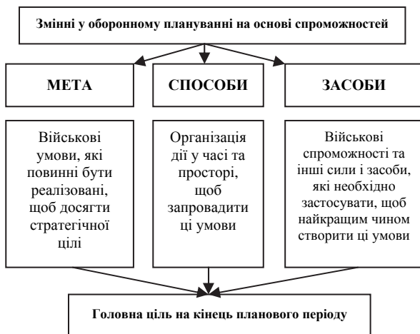
Рис. 3. Зміни в процесі оборонного планування на основі спроможностей

Під час аналізу процесів оборонного планування в різних країнах (Франція, Німеччина, Туреччина, Болгарія тощо) із використанням методу планування на основі можливостей можна виділити основні змінні параметри в ході оборонного планування орієнтованого на застосуванні методу ПОС, для створення необхідних військових умов функціонування власних ЗС (рис. 3).