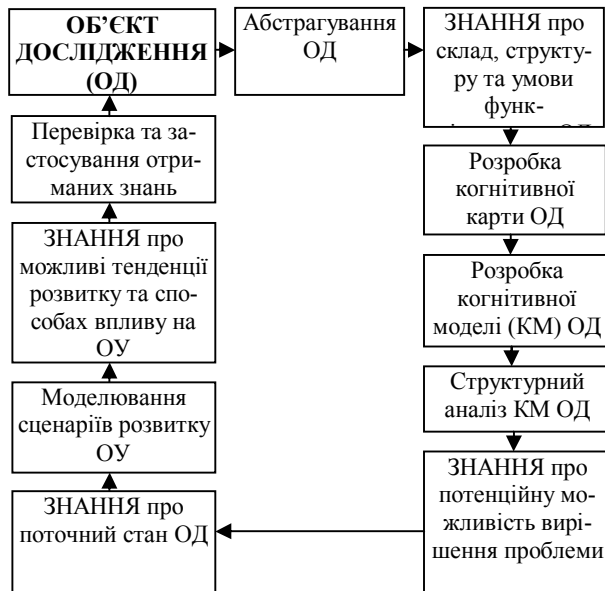
Рис. 1. Схема когнітивного моделювання

Перший етап – абстрагування об'єкту дослідження (ОД): постановка проблеми ( \Pi ), ідентифікація сторін ( U = \{U_i\} ), що втягнуті в проблему, формулювання їх мети ( Z = \{Z_i\} ) та визначення їх можливої поведінки ( P = \{P_i\} ). Цей етап проводиться з використанням методів пізнання ОД, що повинні дозволити отримати кортеж ОД = \langle \Pi, U, Z, P \rangle .