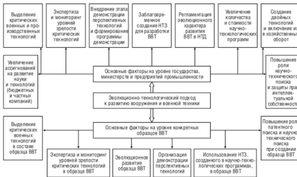
Рис. 4. Основные признаки и факторы, определяющие содержание эволюционно-технологического подхода к развитию ВВТ

Формирование НТЗ и ПТЗ должно охватывать следующие основные наиболее предпочтительные направления деятельности, относящиеся к области военно-технической и оборонно-промышленной политики: