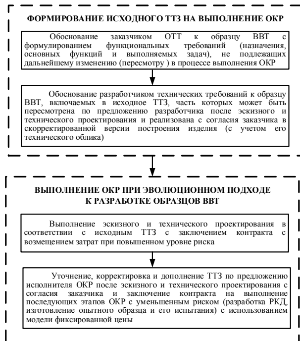
Рис. 2. Возможный (предлагаемый) вариант изменения статуса ТТЗ на выполнение ОКР при эволюционном подходе к разработке и совершенствованию сложных высокотехнологичных (наукоемких) образцов ВВТ с использованием инноваций и спиральной модели последовательного наращивания их функциональных возможностей

Предложения по изменению статуса ТТЗ (рис. 2) позволяют считать контракт выполненным, если предприятием-исполнителем будет подтверждено и доказано, что выработанные решения позволяют эффективно выполнить поставленные заказчиком цель и задачи.