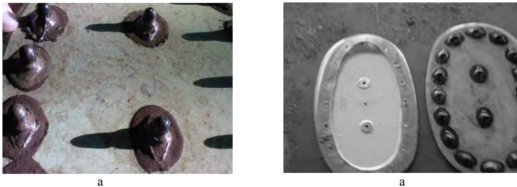
Рис. 4. Разрушение метаболитами уплотнений и герметиков

Защита авиационных топлив от биоповреждений. Мероприятия по предотвращению микробиологического повреждения топлив можно классифицировать на активные и пассивные.