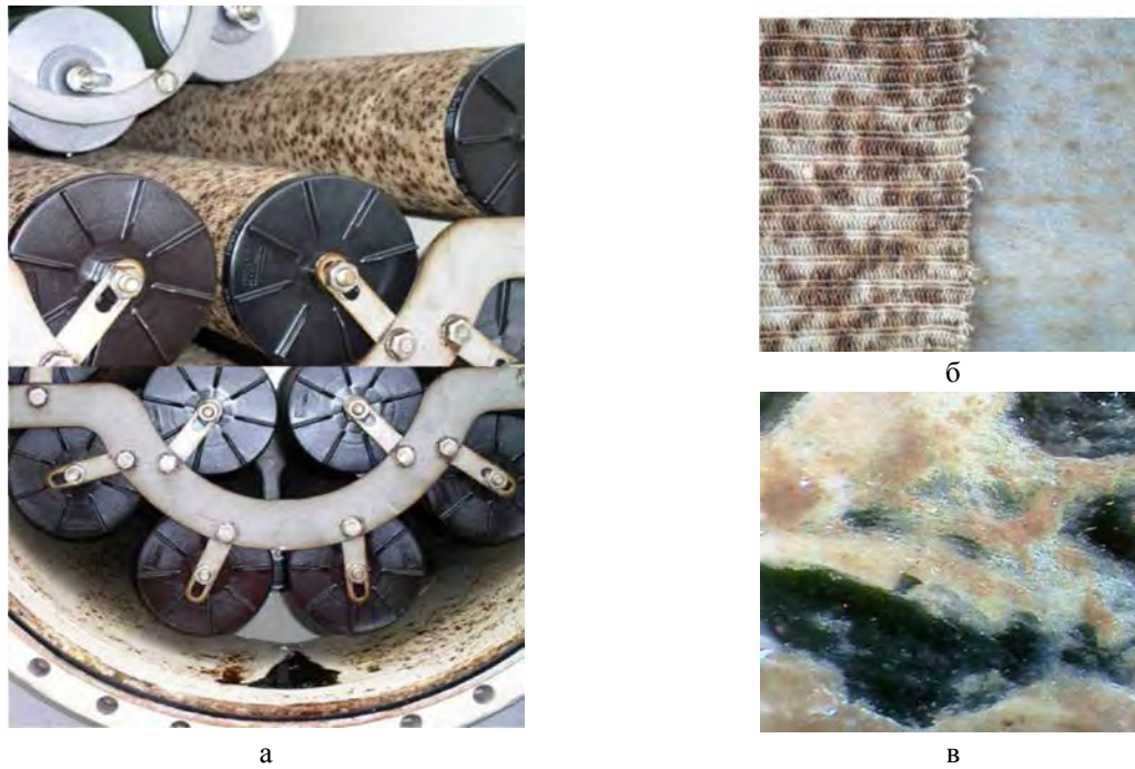
Рис. 3. Бактериальное повреждение наземных топливных фильтроматериалов [2]: а, б) – внешний вид повреждений, в – увеличенное изображение участка фильтра (10 мкм)