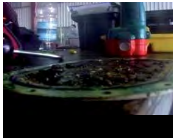
Рис. 2. Панель топливного бака с микробиологическим загрязнением [1]