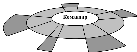
Модульна структура органу управління