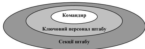
Повна структура органу управління

Аналіз літератури. Враховуючи тенденцію зростання ролі в досягненні мети військових операцій міжвидових угруповань військ (сил), дослідженню розподілених модульних адаптованих органів і пунктів управління в сучасних умовах приділяється значна увага. В [11] аналізується концепція створення органів управління модульного типу (рис. 1), запропонована в 1999 році колишнім головнокомандувачем Об’єднаного центрального командування ЗС США генералом Е. Зінні.