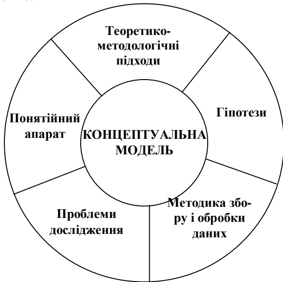
Рис. 2. Структура концептуальної моделі

Для розробки концептуальної моделі (рис. 2) модульних розподілених в просторі пунктів управління силами та засобами збройної боротьби необхідно обґрунтувати понятійний апарат предмету дослідження.