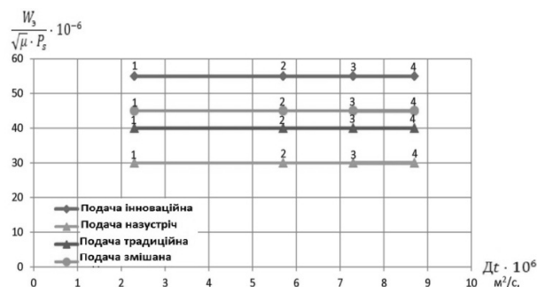
Рис. 2. Залежність відносної інтенсивності випару від коефіцієнта дифузії: 1 – вода; 2 – дизпаливо; 3 – бензини; 4 – толуол