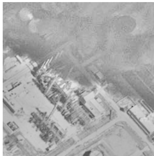
Рис. 4. Нормализованное изображение, полученное по выражению (3)

зование совпадает с известным преобразованием Retinex, которое широко используется для восстановления изображений при воздействии протяженных маскирующих помех [10 – 12].