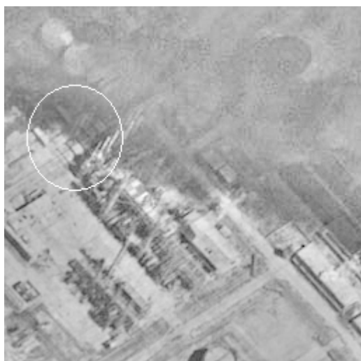
Рис. 3. Нормализованное изображение матрицы локальных размерностей, k = 0, 1, \dots, 6 (эффект восстановления)

Для сравнения, на рис. 4 приводится результат восстановления по формуле (3). Данные изображения являются практически идентичными, что позволяет говорить о правомерности использования выражения (3) для аналитического расчета локальной размерности, не смотря на принятые упрощения. Тем не менее, следует отметить, что на изображении рис. 3 присутствуют мелкие детали (обведены кружком), не обнаружимые на рис. 4 (например, тени от труб нефтеперерабатывающего комплекса, падающие на проходящую рядом дорогу).