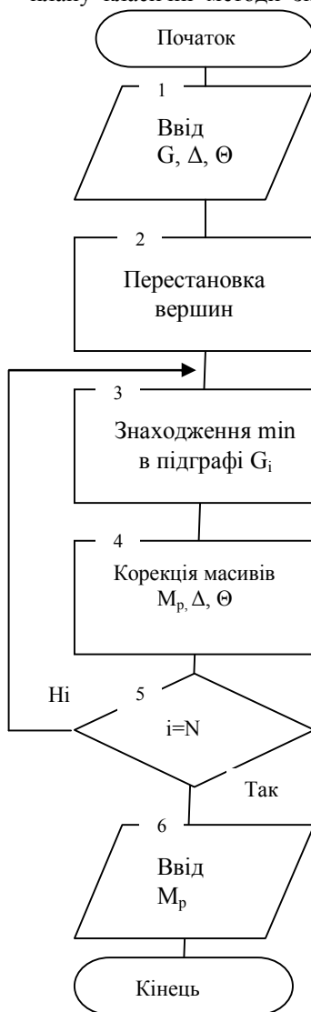
Рис. 1. Алгоритм знаходження квазіоптимального плану

Один зі шляхів підвищення ефективності запропонованої методики планування полягає в розробці алгоритму приведення складних різнотипних об'єктів, що спостерігаються, до простих, що дозволить зменшити час розрахунків практично без втрати оптимального рішення.