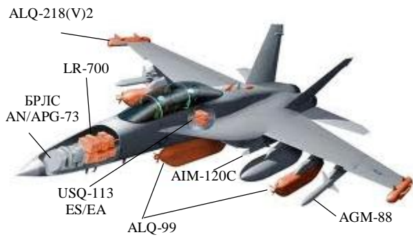
Рис. 2. Літак РЕБ EA-18G “Growler”

Основні характеристики: екіпаж – 2 чол.; максимальна швидкість – 2 150 км/год; бойовий радіус – 833 км (з 3 підвісними паливними баками); практична стеля – 15 850 м; 11 точок підвіски. Радіоелектронні засоби: бортова РЛС “Raytheon” AN/APG-73; ALQ-99 (підвісні контейнери); комплекс РЕБ ALQ-218(V)2; станція РЕБ (подавлення РЛС) LR-700; станція завад, що буксирується AN/ALE-50, або AN-ALE-55 (fiber-optic); прилад сигналізації про опромінення РЛС противника AN/ALR-67(V)3; комплекс зв’язку USQ-113 ES/EA; ІЧ-пастки AN/ALE-47 або AN/ALQ-214 RF. Бойове завантаження: авіабомби й керовані ракети “повітря – поверхня” AGM-65 “Maverick”, AGM-84 “Harpoon”, AGM-84E “SLAM”, AGM-84H “SLAM-ER”, AGM-88 “HARM”, GBU-10/-12/-16/-24, GBU-31/-32 “JDAM”, AGM-154 “JSOW”; керовані ракети “повітря – повітря”: 2 AIM-9 і 6 AIM-120C/AIM-7 або 8 AIM-120C/AIM-7.