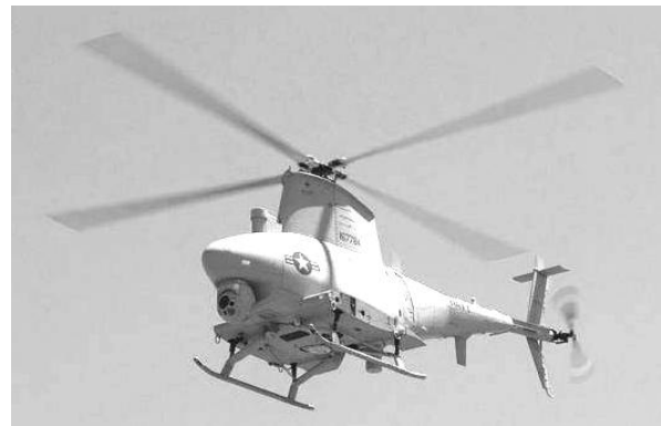
Рис. 3. Безпілотний вертоліт MQ-8B “Fire Scout”

У якості альтернативного корисного навантаження можуть використовуватися блоки тактичної системи цифрового зв’язку (TCDL), система виявлення установки мінних полів (ASTAMIDS), система збору секретної інформації шляхом перехоплення сигналів і повідомлень (модуль SIGINT), тактичний радар із синтезованою апертурою й селектором рухомих цілей (TSAR with MTI). Даний апарат планується використовувати для розширення можливостей наземної інтегрованої мережі розвідувальних датчиків [5].