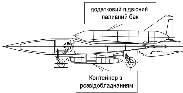
Рис. 2. Схема БПЛА з верхнім розташуванням додаткового паливного баку та нижнім розташуванням контейнера з розвідобладнанням

Положення середньої аеродинамічної хорди по поздовжній осі літака X .